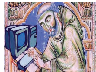
“Monk at Computer” from the Centre for the History of the Book, University of Edinburgh